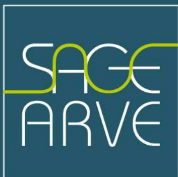
Schéma d'Aménagement de Gestion des Eaux du bassin de l'Arve